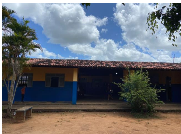
VISTA PINTURA ESCOLA E RETELHAMENTO