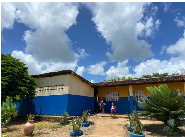
VISTA PINTURA ESCOLA