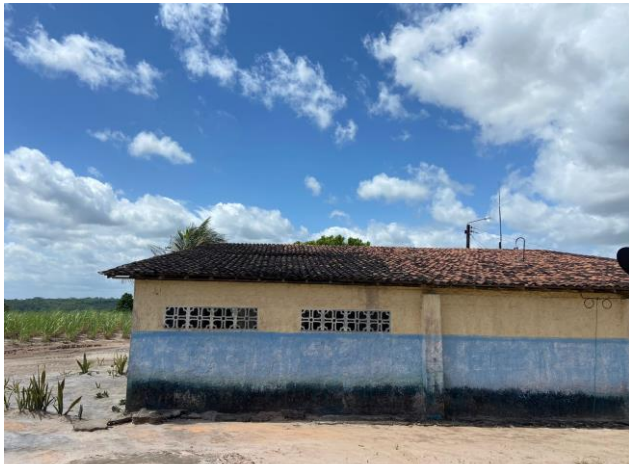
VISTA PINTURA E RETELHAMENTO ESCOLA