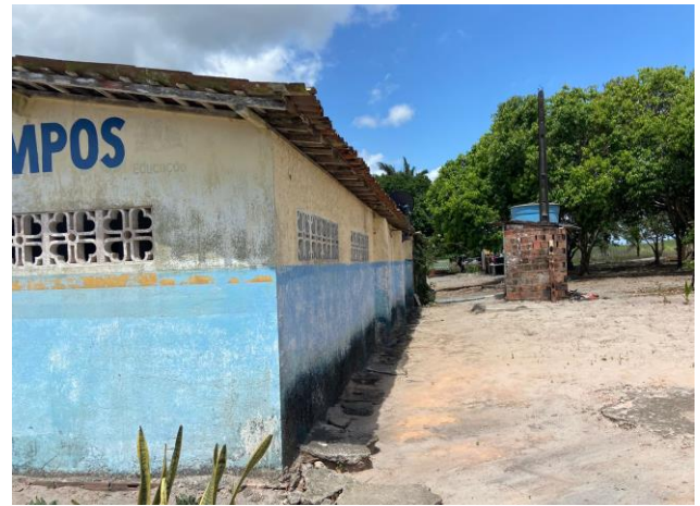
VISTA PINTURA ESCOLA