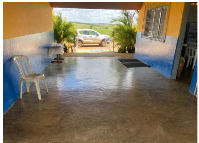
VISTA PINTURA ESCOLA