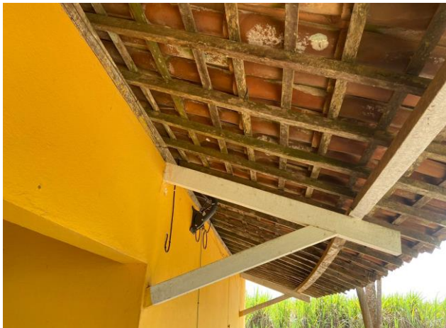
VISTA PINTURA E RETELHAMENTO ESCOLA