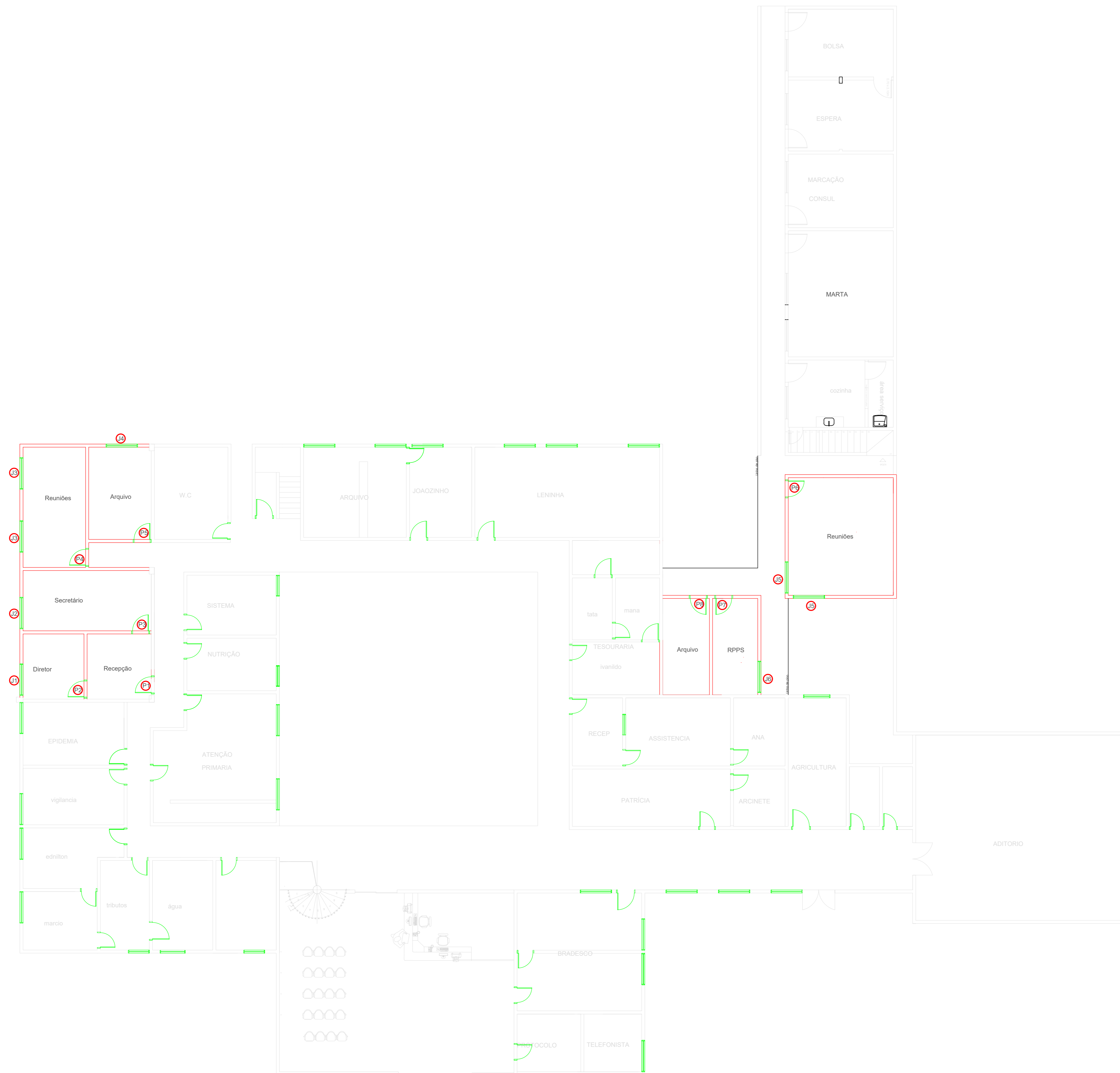
PLANTA BAIXA TÉRREO ESC. 1/100